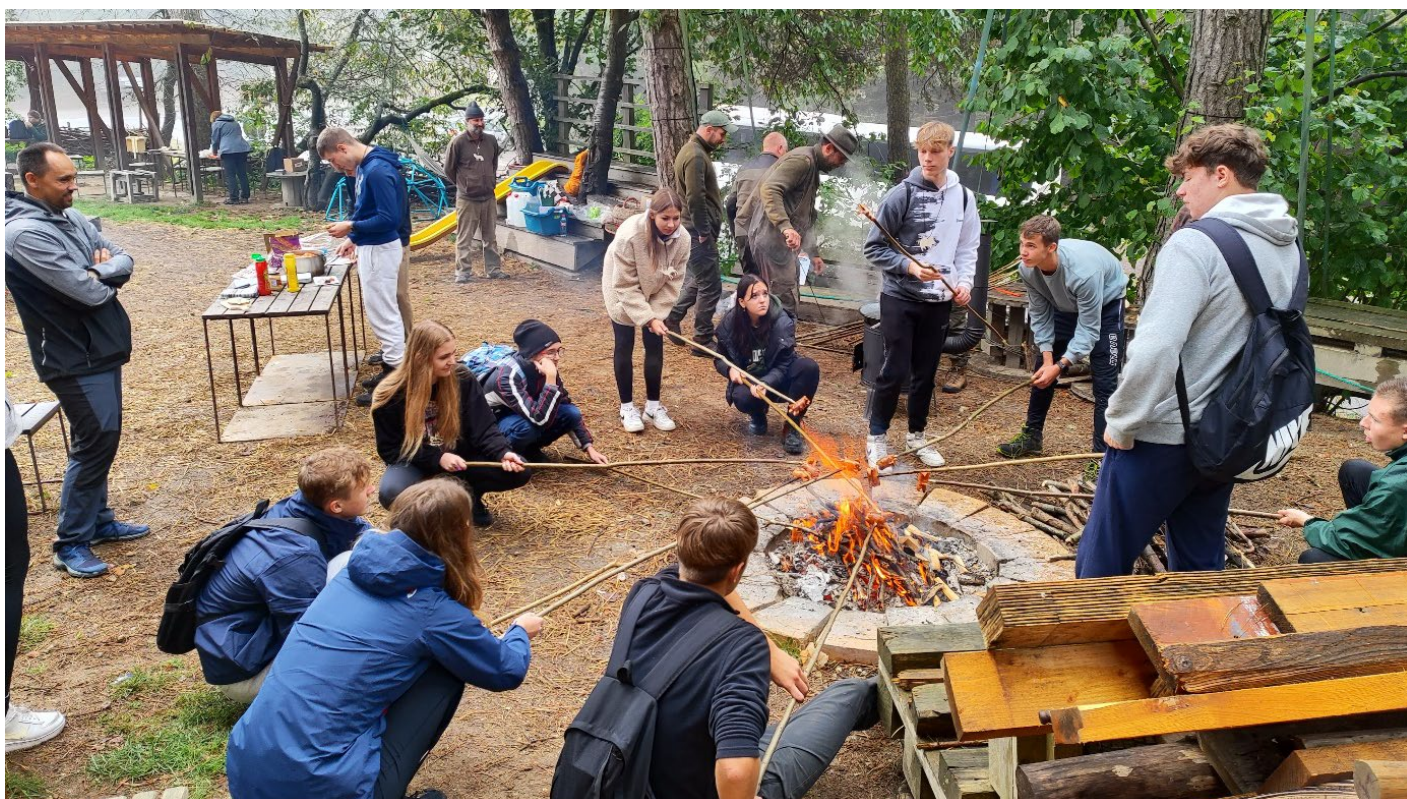
Príprava občerstvenia v lesoch so stredoškólakmi v rámci projektu LESU ZDAR.